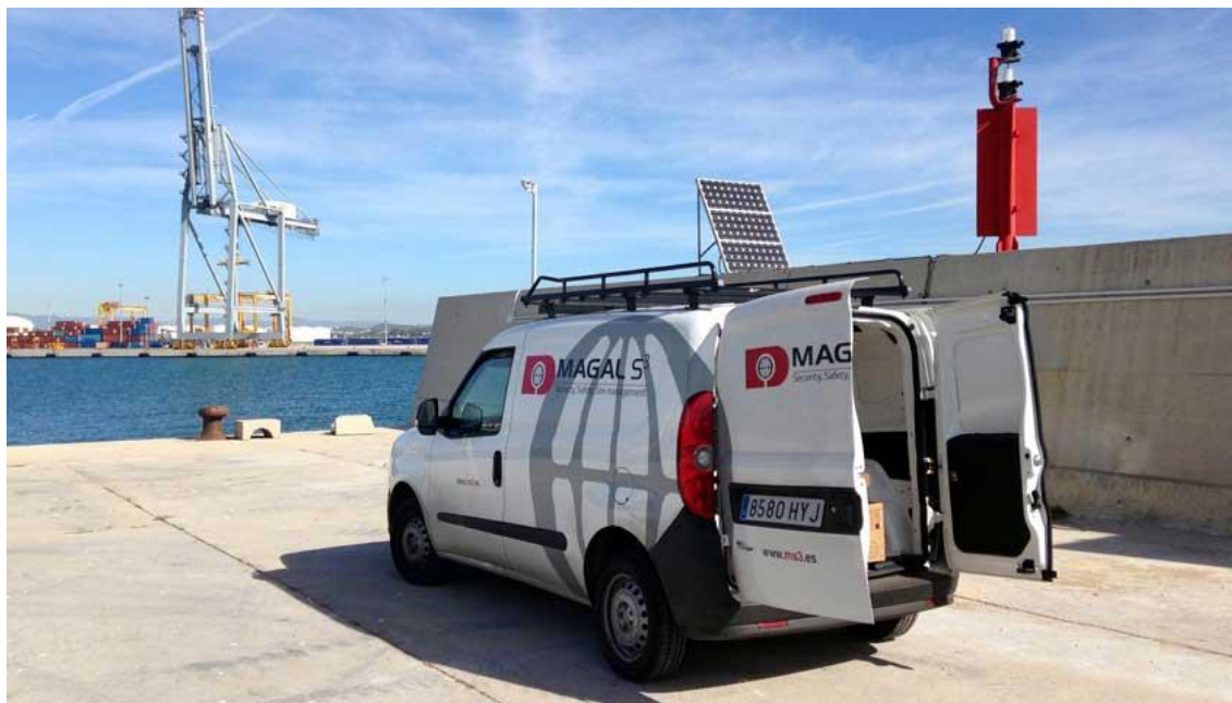
Imatge: Equip de Magal en el Port de Tarragona. Extreta de web corporativa Magal S3