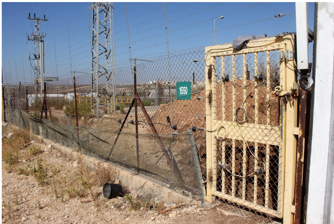
Porta del Mur de Separació equipada amb tecnologia de Magal.

confiscació per 4.2 milions de dòlars i en aquest mateix any una nova licitació per 6.1 milions de dòlars. El sistema de seguretat utilitzat en el mur és el «BVS-5000 fence» 45 .