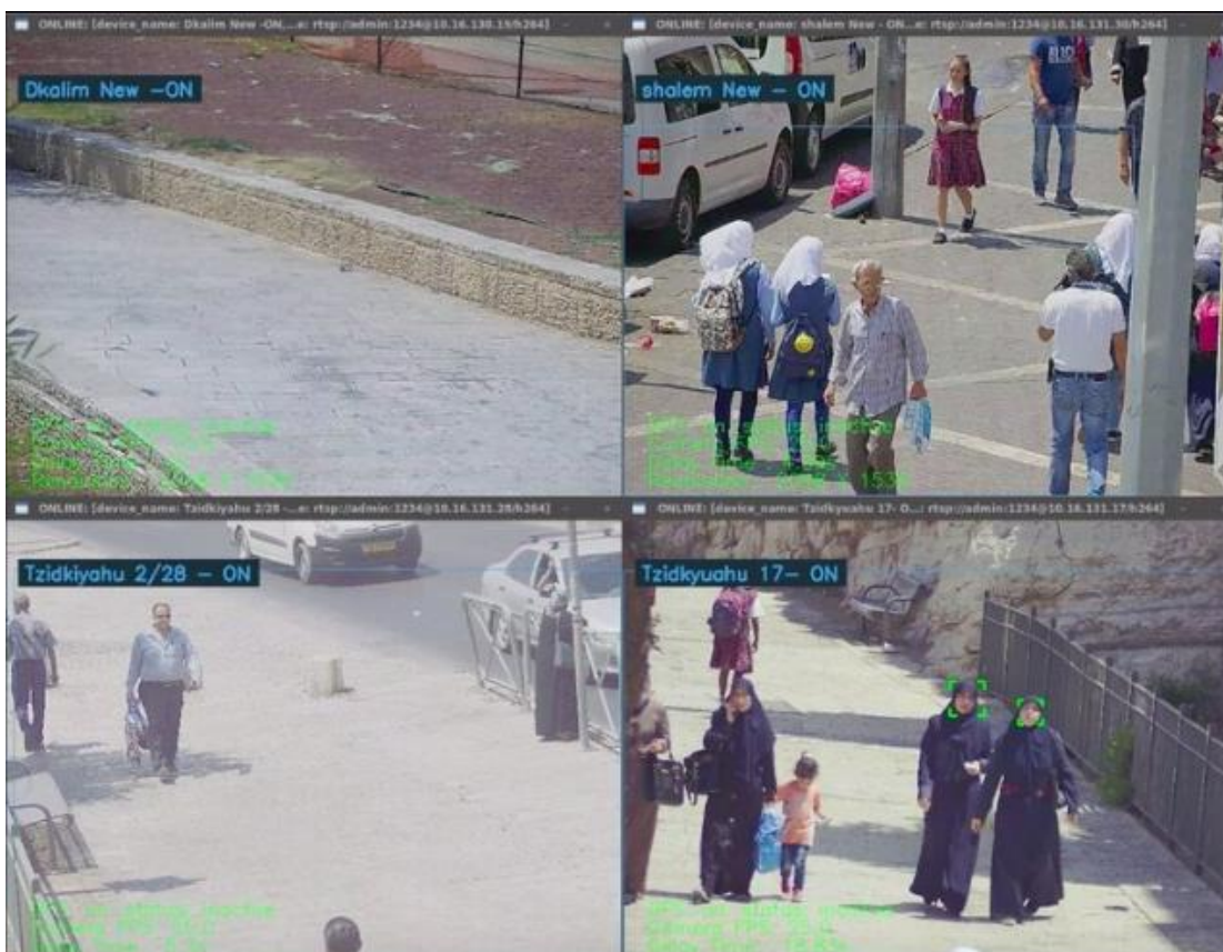
Imatge: Sistema Better Tomorrow sent utilitzat contra població civil de Jerusalem Est.

El perill d'aquesta tecnologia radica en que té el potencial suficient per eliminar la privacitat als espais públics. A més, la tecnologia no és del tot precisa, sempre existeix risc de falsos positius. En 2019, The American Civil Liberties Union (ACLU) va realitzar un test del Programari de reconeixement facial d'Amazon anomenat "Rekognition" i es van donar 28 casos de congressistes relacionats de forma errònia amb persones que havien estat arrestades amb anterioritat per la comissió d'un delictes. ACLU també va confirmar que aquesta tecnologia de reconeixement facial desenvolupada pel Programari Rekognition, afectava desproporcionadament a la població negra per la seva gran imprecisió i biaix racial a l'hora d'identificar a les persones. 34