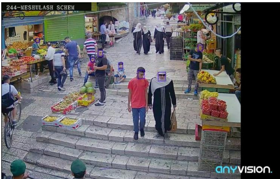
Imatge: Sistema Better Tomorrow sent utilitzat contra població civil de Jerusalem Est.