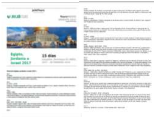
Imagen: Oferta turística del Tour a Oriente Medio 2017 de Julià Tours

La empresa Grupo Julià ofrece paquetes turísticos designando a Jerusalén como capital de Israel. En sus ofertas turísticas tampoco da ningún tipo de información de la situación de ocupación de los Territorios Ocupados Palestinos. Sus paquetes turísticos no incluyen estancias en los TOP, a pesar de que muchas de las actividades se realizan en áreas de Cisjordania.