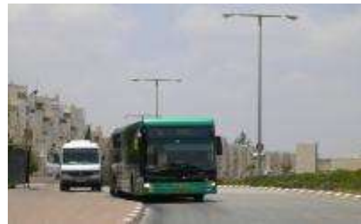
Imagen: autobús de línea Egged

La empresa Irizar participa en el diseño de los autobuses de la principal empresa de transporte pública de Israel, Egged. Egged ofrece líneas de transporte de bus en casi todos los asentamientos ilegales de Israel en los TOP. En el año 2014, Egged adquirió 152 buses de la empresa Mercedes OC500 intercity buses, Man NG363 buses, y 40 Scania buses. A partir de ese momento, la empresa lanzó 6 nuevas líneas para conectar los asentamiento de Neveh Daniel en Beit Shemesh estación de tren, y del Kibbutz Kfar Etzion; también conectando Jerusalén vía Elad con el asentamiento de Nokdim in Gush Etzion. Así como una nueva línea entre Tel Aviv y el asentamiento de Modi'in.