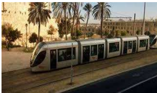
Imagen: Jerusalem Light Rail a la ciudad de Jerusalem

La empresa española de consultoría de transporte Ineco participa en el consorcio internacional para la construcción del "Jerusalén light train", el tranvía que conecta los grandes bloques de asentamientos ilegales del Este de Jerusalén con la parte occidental de la ciudad. Este sistema permite el rápido movimiento de colonos en Cisjordania, mientras que la ocupación provoca graves restricciones de la libertad de movimiento de los palestinos. Por tanto, el proyecto de transporte contribuye a la política de expansión de los asentamientos ilegales y a la expropiación de tierras palestinas para su construcción. La política de colonización de Israel basada en la expropiación, anexión y explotación de recursos naturales palestinos es un delito internacional, condenado por Naciones Unidas.