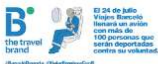
Imagen de la campaña #BarcelóDeporta contra la empresa Barceló Viajes.

La plataforma Tanquem Els CIE (Cerramos los CIE) lanzó el año pasado una campaña contra las deportaciones masivas de migrantes y las empresas que participan. La campaña se centró en denunciar la complicidad de Barceló Viajes en los vuelos de deportación.