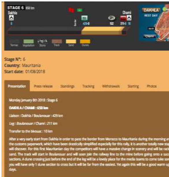
Imagen: Etapa 6 del Tour "African Eco Race" a su paso por Dakhla

mecanismos de control de la ocupación. Si consultamos el Ministerio de Turismo Israelí observamos que en ninguna de sus publicaciones aparece la frontera ni el nombre de Palestina. Todo lo contrario, promueve visitas a territorios ocupados en especial en Jerusalén Este y sus lugares sagrados, como parte de Israel. El año 2013 el Ministerio de Turismo publicó material de promoción de Belén incluyendo puntos de interés como la Iglesia de la Natividad como patrimonio cultural israelí. Según una encuesta llevada a cabo por ATG el 57% de los peregrinos que visitan la Iglesia de la Natividad en Belén creen que están en una ciudad israelí 51 . En muchas páginas web de Tour operadores 52 encontramos las denominaciones "Judea y Samaria" y "Tierra Santa" para evitar los nombres Cisjordania o Palestina. Este uso de términos bíblicos es un intento de invisibilizar la existencia de personas palestinas 53 .