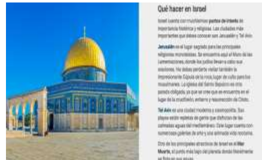
Imagen: Información del viaje turístico ofrecido por per Halcón Viajes a Israel

Designa Jerusalén como capital en la página web de su principal mayorista: "Jerusalén es la capital de Israel y la ciudad más grande y poblada"; "La meta de la peregrinación cristiana en Tierra Santa es la ciudad de Jerusalén. Fundada hace unos cinco mil años, pertenece al Estado de Israel". En su buscador también muestra Jerusalén como parte de Israel, así como que los hoteles Mount of Olives y Hotel Addar están en Israel, cuando en realidad se encuentran en la parte este de Jerusalén en los TOP.