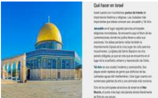
Imatge: Informació del viatge turístic ofert per Halcón Viatges a Israel

Designa Jerusalem com a capital en la pàgina web del seu principal majorista: "Jerusalén es la capital de Israel y su ciudad más grande y poblada"; "La meta de la peregrinación cristiana a Tierra Santa es la ciudad de Jerusalén. Fundada hace unos cinco mil años, pertenece al Estado de Israel". En el seu cercador també mostra Jerusalem com a part d'Israel i que els hotels Mount of Olives i Hotel Addar estan a Israel, quan en realitat es troben a la part est de Jerusalem als TOP.