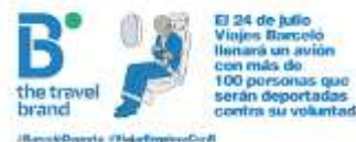
Imatge: de la campanya #BarcelóDeporta contra l'empresa Barceló Viajes.

La plataforma Tanquem els CIEs va llançar l'any passat una campanya contra les deportacions massives de migrants i en contra les empreses que participaven. La campanya es va centrar a denunciar la complicitat de Barceló viatges en els vols de deportació.