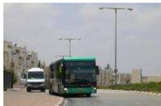
Imatge: autobús de línia Egged

L'empresa Irizar participa en el disseny dels autobusos de la principal empresa de transport pública d'Israel, Egged. Egged ofereix línies de transport de bus a quasi tots els assentaments il·legals d'Israel als TOP. L'any 2014, Egged va adquirir 152 busos de les empreses Mercedes OC500 intercity buses, Man NG363 busos, i 40 Scania busos. A partir d'aquell moment, l'empresa va llençar 6 noves línies per connectar els assentaments de Neveh Daniel a Beit Shemesh estació de tren, i del Kibbutz Kfar Etzion; també connectant Jerusalem via Elad amb l'assentament de Nokdim in Gush Etzion. Així com una nova línia entre Tel Aviv i l'assentament de Modi'in .