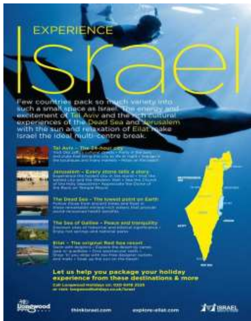
Imatge: Exemple d'anunci de l'oficina de Turisme del Govern d'Israel on el mapa d'Israel inclou part dels territoris Ocupats Palestins i sirians: els Alts del Golan, Gaza i Cisjordània.

política d'expropiació de cases i transferència de colons israelians a les àrees palestines establertes pels acords de Nacions Unides. Aquests acords determinen que Jerusalem és una ciutat sota protecció i administració de Nacions Unides, el que significa que no pertany ni a Israel ni a Palestina. Recentment, l'Assemblea General de Nacions Unides ha declarat nul la declaració unilateral dels Estats Units de reconèixer Jerusalem com a capital d'Israel 55 . Paral·lelament, parlamentaris europeus han denunciat a principis d'any l'estratègia de falses narratives que Israel està desenvolupant a través de la promoció i excavacions d'indrets arqueològics i històrics en els barris de majoria àrab de Jerusalem amb l'objectiu de legitimar els assentaments en aquella part de la ciutat 56 .