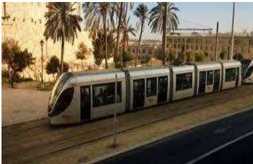
Imatge: Jerusalem Light Rail a la ciutat de Jerusalem

L'empresa espanyola de consultoria de transport Ineco participa en el consorci internacional per la construcció del "Jerusalem light train", tramvia que connecta els grans blocs d'assentaments il·legals de l'Est de Jerusalem amb la part occidental de la ciutat. Aquest sistema permet el ràpid moviment de colons a Cisjordània, mentre que l'ocupació provoca greus restriccions de la llibertat de moviment dels palestins. Per tant, el projecte de transport contribueix a la política d'expansió dels assentaments il·legals i a l'expropiació de terres palestines per la seva construcció. La política de colonització d'Israel basada en l'expropiació, annexió i explotació de recursos naturals palestins és un delictes internacional, condemnat per Nacions Unides.