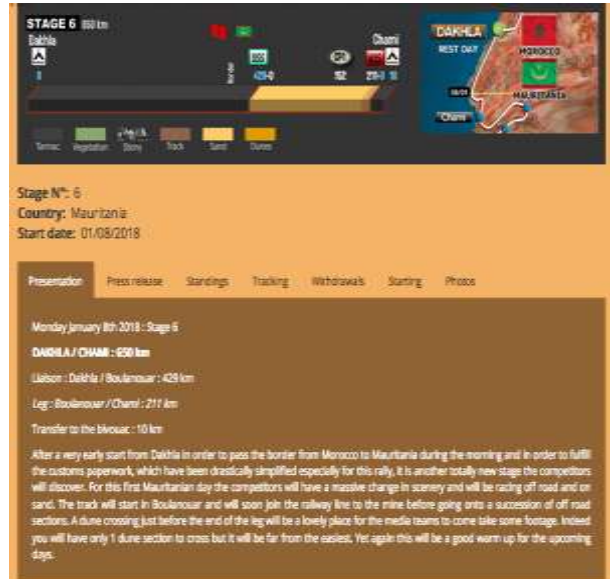
Imatge: Etapa 6 del Tour "African Eco Race" al seu pas per Dakhla

Aquesta informació enganyosa amaga situacions de greus vulneracions de drets humans, on els promotors turístics obtenen grans beneficis econòmics expropiant recursos de les poblacions indígenes sense la seva autorització. Un exemple històric ha estat el Rally Paris-Dakar que durant dècades s'organitzava entre França i el Senegal, creuant punts de la geografia del Sàhara Occidental. No obstant aquest tipus d'esdeveniments continua produint-se. El Front Polisari, representant del poble sahrauí, va denunciar recentment, l'acte esportiu "African Eco Race" entre Mònaco i Dakar amb etapes en els Territoris Ocupats Sahrauí. De fet l'acte va ser organitzat entre les organitzacions i les autoritats marroquines, sota la supervisió de la Missió de Nacions Unides, però sense involucrar les autoritats sahrauí. En la imatge inferior es pot veure com no es fa cap referència al fet que l'etapa 6a a Dakhla és territori del Sàhara Occidental, tot al contrari, només apareixen les banderes de Marroc i Mauritània, fet que vulnera el dret internacional i suposa informació esbiaixada. Empreses que han obtingut adjudicacions públiques a l'Estat espanyol, com IVECO España , han participat en aquest esdeveniment esportiu per promocionar els seus vehicles.